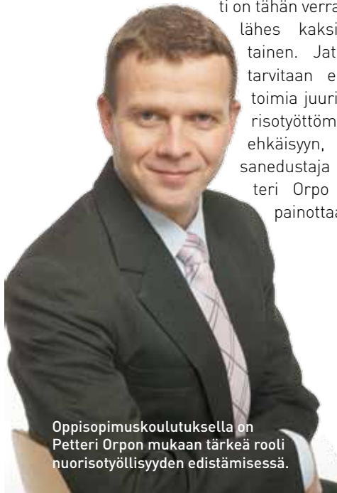
Oppisopimuskoulutuksella on Petteri Orpon mukaan tärkeä rooli nuorisotyöllisyyden edistämässä.

lähes kaksinkertainen. Jatkossa tarvitaan erityistoimia juuri nuorisotyöttömyyden ehkäisyyn, kansanedustaja Petteri Orpo (kok) painottaa.